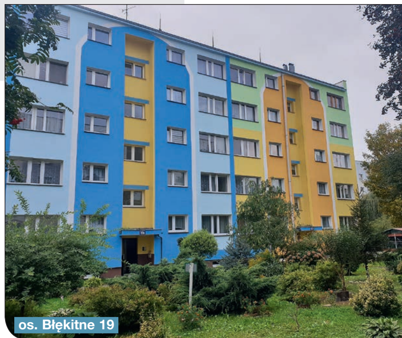
os. Błękitne 19

- na os Tęczowym 5b, 7b,c zostały zdemontowane stare