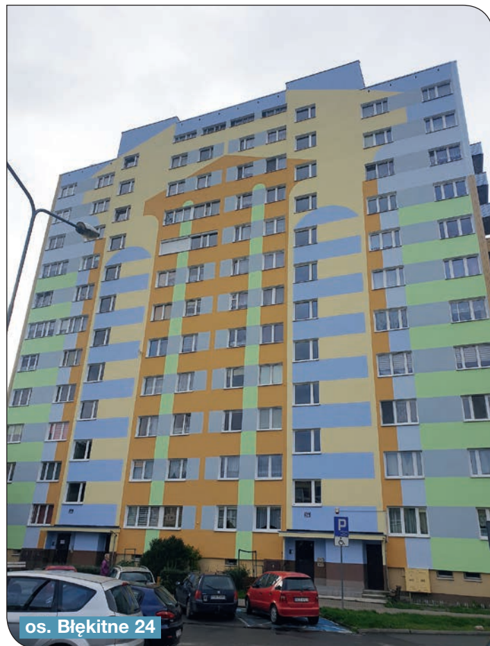
os. Błękitne 24