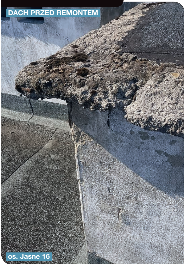
os. Jasne 16