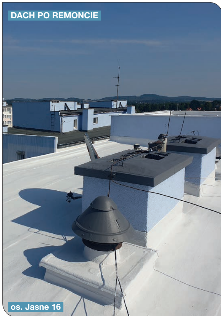
os. Jasne 16