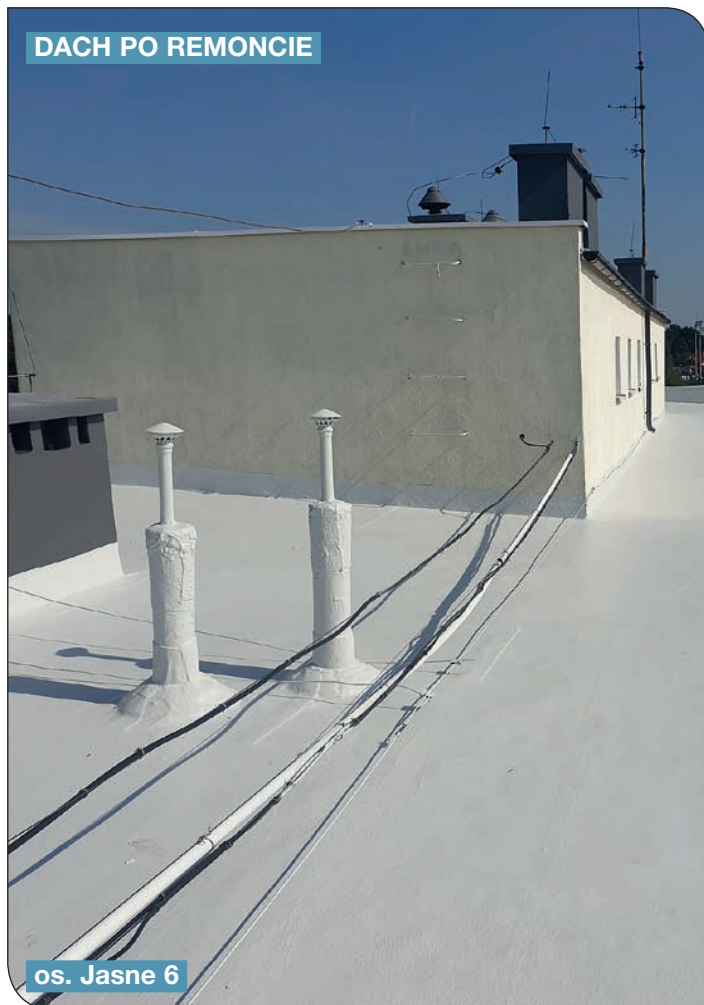
os. Jasne 6