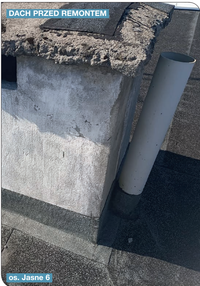
os. Jasne 6